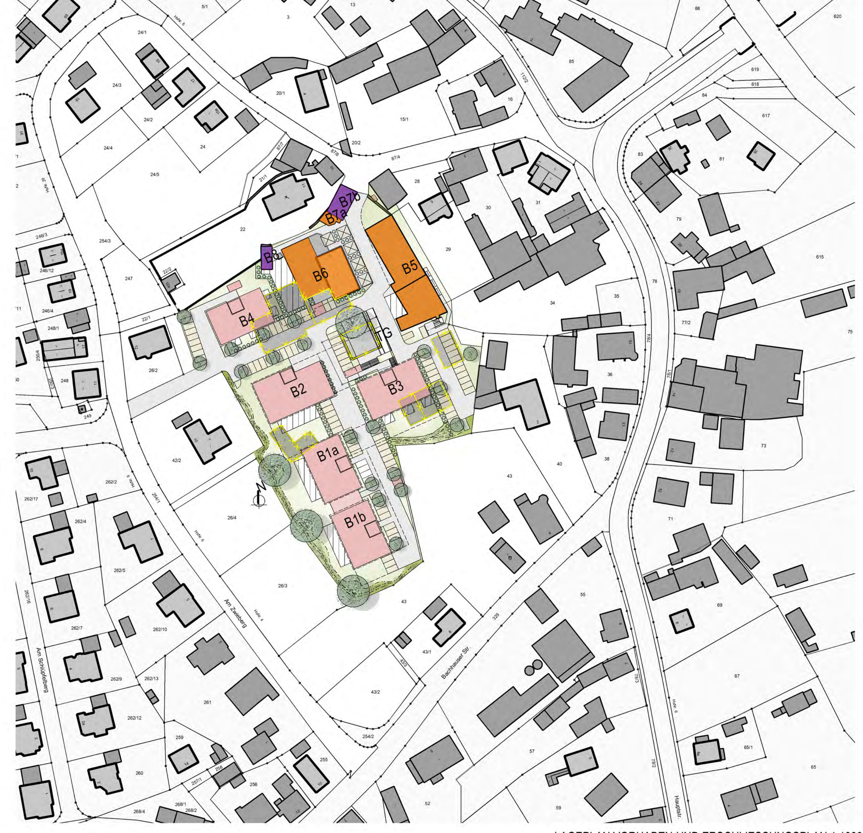
LAGEPLAN VORHABEN-UND ERSCHLIESSUNGSPLAN 1:1000