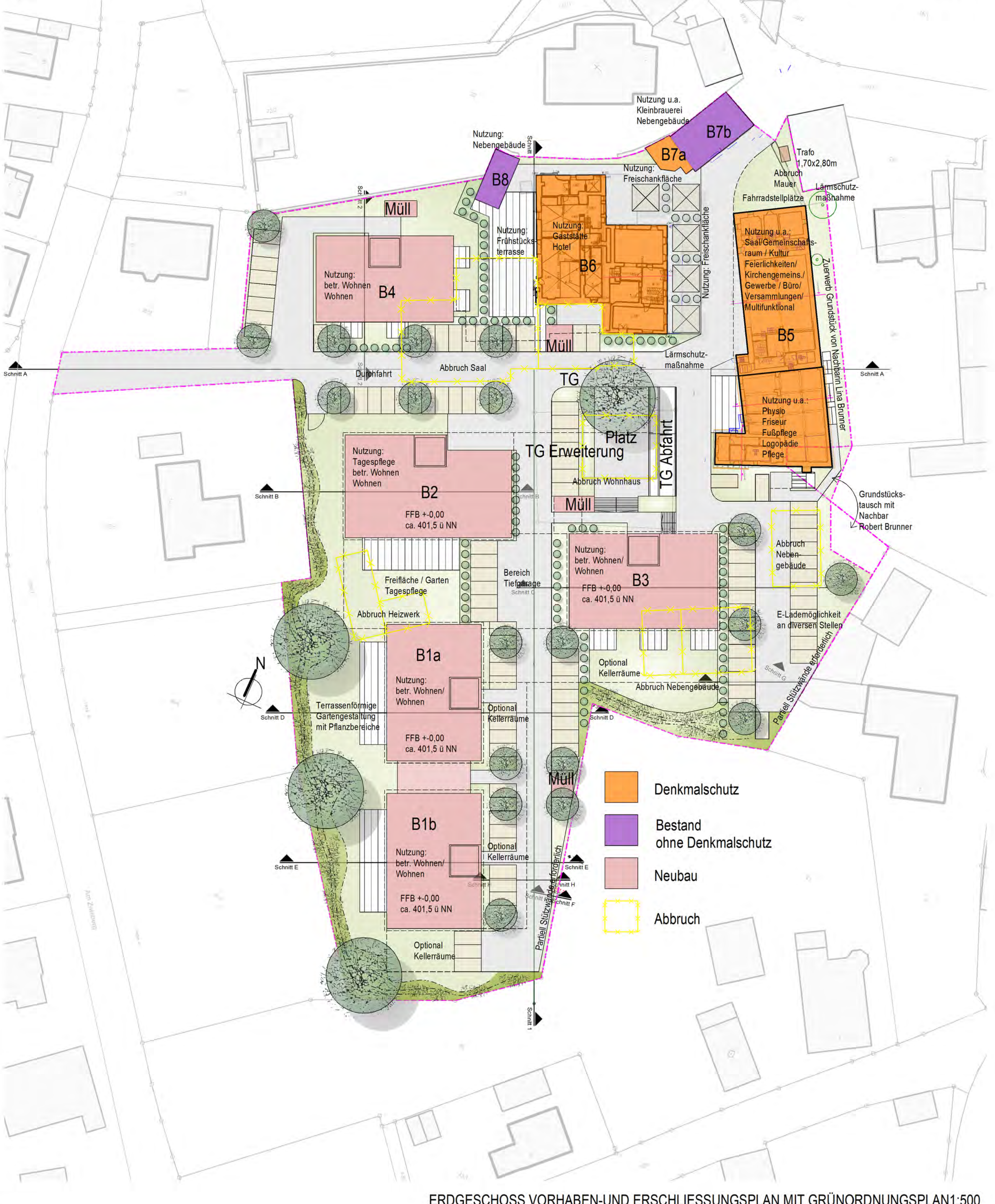
ERDGESCHOSS VORHABEN-UND ERSCHLIESSUNGSPLAN MIT GRÜNORDNUNGSPLAN 1:500