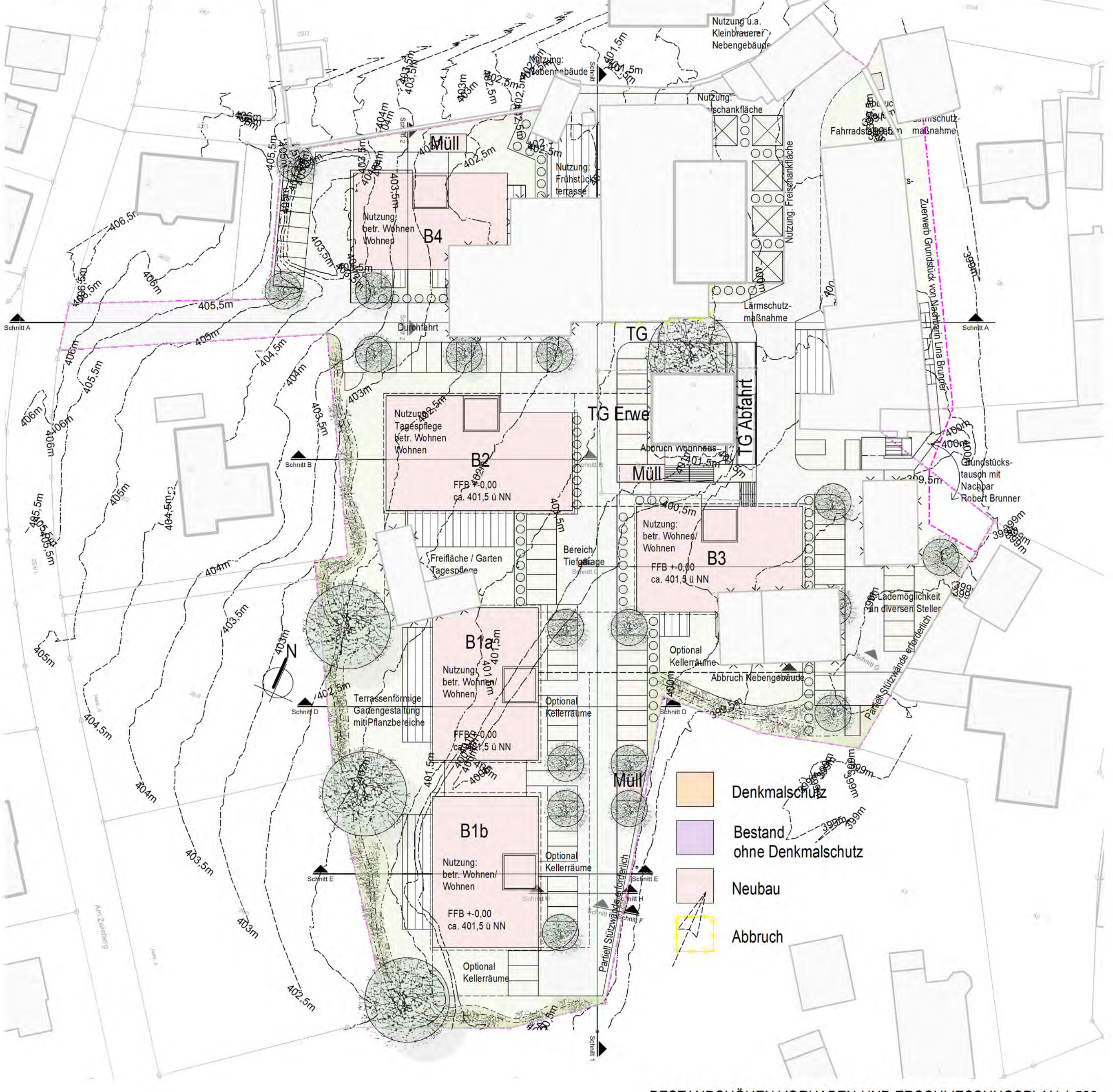
BESTANDSHÖHEN VORHABEN-UND ERSCHLIESSUNGSPLAN 1:500